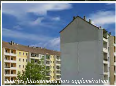
Pour les lotissements hors agglomération