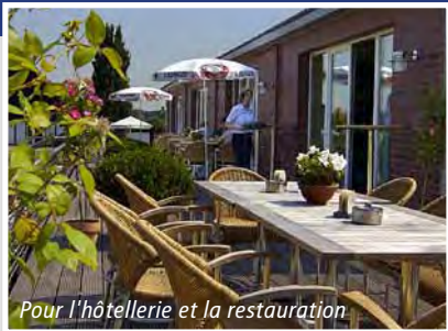
Pour l'hôtellerie et la restauration