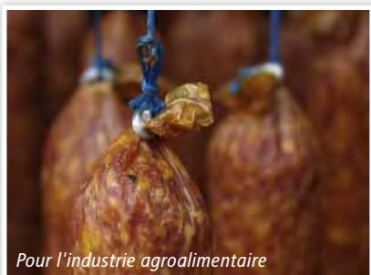
Pour l'industrie agroalimentaire